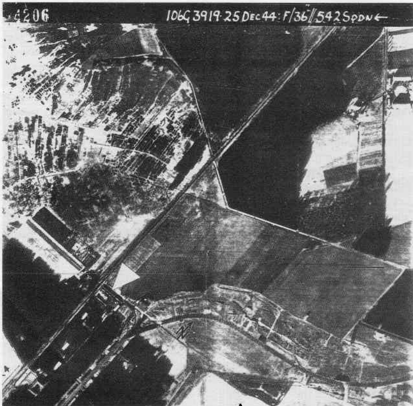
Luftbild der Royal Air Force vom 25.12.1944

Gleich den entsprechenden Einrichtungen in Ladelund (Nordfriesland) und Husum-Schleswig ist auch das KZ-Außenkommando Kaltenkirchen als deutliches Vorzeichen der sich abzeichnenden militärischen Niederlage des deutschen Reiches zu betrachten. Zwar sind keine einschlägigen Dokumente auffindbar, so kann doch als sicher gelten, dass die Errichtung dieses Lagers auf das Betreiben der Wehrmacht, in diesem Fall der Luftwaffe, zurück zu führen ist. Im Interesse